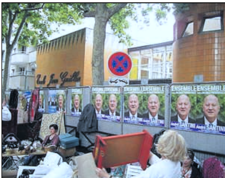
RUE GRENIER, HIER. Selon l'officier de police venu constater le préjudice, l'arrière des panneaux ne ferait pas partie de l'affichage obligatoire. Le principe d'équité n'aurait donc pas besoin d'être respecté.

« Ces panneaux sont prévus pour permettre aux candidats d'être présentés dans le strict respect d'un principe d'équité. Et tout affichage est interdit sur l'emplacement réservé aux autres candidats. André Santini fait la démonstration de son mépris pour ces règles essentielles au bon fonctionnement de la démoc-